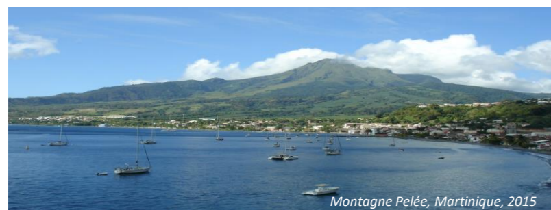
Montagne Pelée, Martinique, 2015